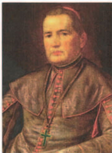
Štefan MOYSES 24. 10. 1797 - 5. 7. 1869

Rode môj, milý národe slovenský! Spal si duševne stá, ba tisíce liet, precitni už niekedy a zmužni... Postavže sa na bezpečné plecía prírodzených vodcov svojich, by si sa povýšil. Otvor ochotne oči svetlu pravdy a užitočných vedomostí, ktoré ti domáci vzdelancovia tvoji v podobe zrozumiteľnej, v prírodzenej tvojej jadrnej reči prednášajú. Pracuj pilne na národa roli dedičnej.